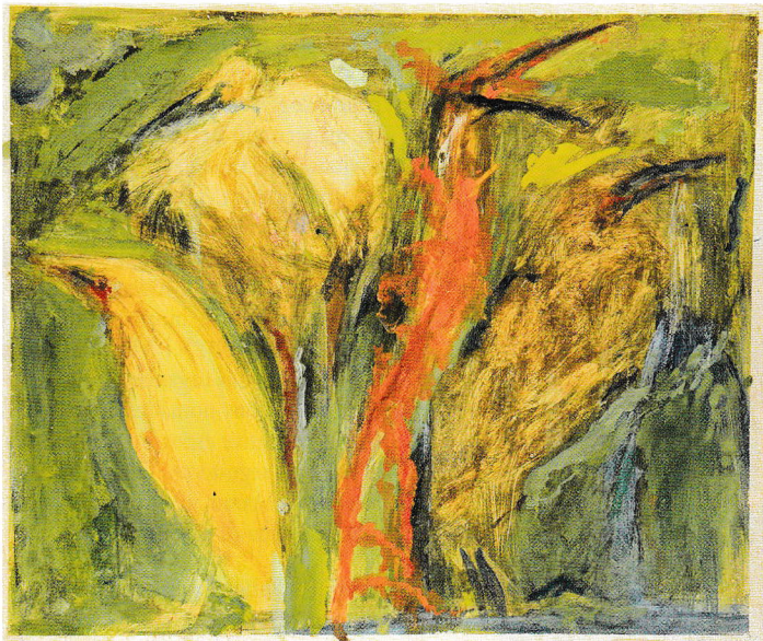
Raffaello Fiumana senza titolo, tempera all'uovo e olio su cartoncino, cm 37,5 x 44,5.

La mostra allo Spazio espositivo La Cornice (in Via Giacometti 1 a Lugano) rimarrà allestita fino ad oltre metà febbraio. Gli orari d'apertura della raccolta galleria - che seguono quelli dell'omonimo negozio di articoli per artisti nella quale è ospitata - permettono di ammirare le opere da lunedì a venerdì nell'orario 8.00-12.00 e 14.00-18.30; sabato dalle 9.00 alle 12.00. Gran parte dei lavori artistici sono sempre visibili dall'esterno nelle ampie vetrine che danno sul marciapiede.